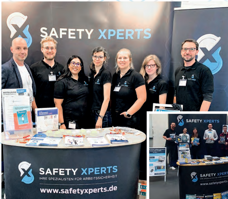
AplusA-Messe 2019 und 2021

Als Unternehmensbereich der VNR Verlag für die Deutsche Wirtschaft AG hat es sich Safety Xperts zum Ziel gesetzt, Verantwortliche für den Arbeits- und Gesundheitsschutz mit Top-Experten zusammenzubringen. In Form von Events, Messen, Fachpublikationen und digitalen Lösungen unterstützen wir unsere Kunden der verschiedensten Branchen bei ihren täglichen Herausforderungen. Sicherheit, beruflicher Erfolg und ein gutes Gefühl bei unseren Kunden sind unser Ansporn!