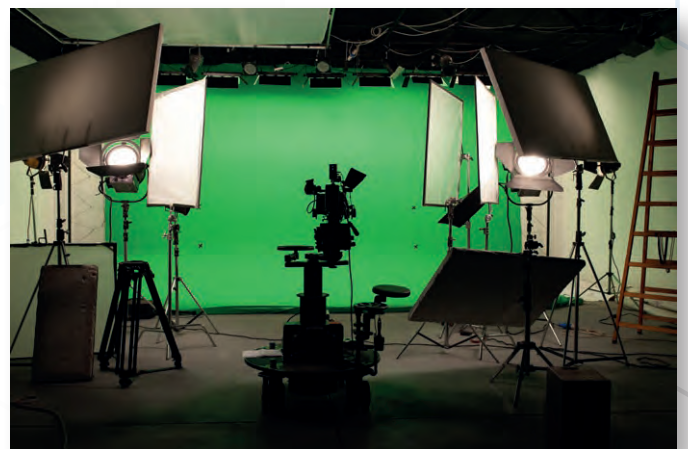
Die Moderation übertragen wir für Sie live aus Bonn. Folgen Sie uns ganz bequem aus dem Homeoffice oder Ihrem Büro.