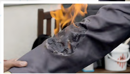
Safety Xperience Day 2019 mit Feuerlöschung