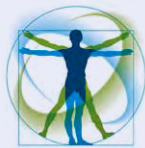
Betriebliches Gesundheits- management