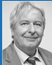
Paul Benz |B|E|N|Z| Brandschutz- ingenieurgesellschaft GmbH & Co. KG, Tauberbischofsheim